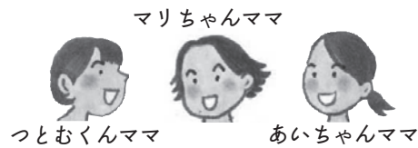
マリちゃんママ つとむくんママ あいちゃんママ