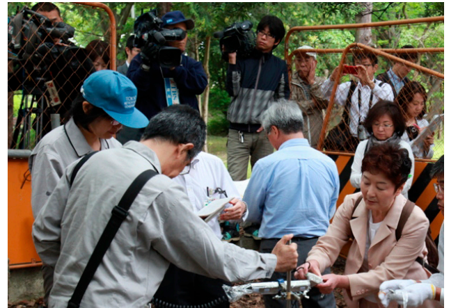
東京都に都立水元公園のホットスポットの除染をおこなわせお母さんたちに喜ばれています

「東京湾岸やゼロメートル地帯の堤防や水門は、現状では大地震に対応できない」。現場調査をふまえての共産党都議団のくり返しの追及に、東京都も耐震強化10年計画を決め、耐震化がすすむことになりました。