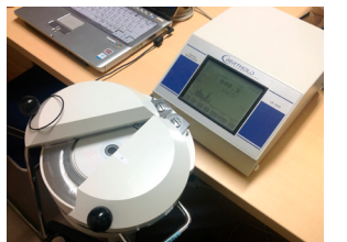
カンパを集めて独自購入した食品・土壌用放射能測定器

「都内でも放射線のホットスポット見つかる」…共産党都議団による都内各地の放射線測定結果が、テレビや週刊誌に大きくとりあげられ、外国のメディアも注目。まともに調査も対策もしない東京都に対し、共産党都議団は、専門家にも協力してもらい、調査を実施。ついに、東京都も測定や除染に踏み出さざるをえなくなりました。