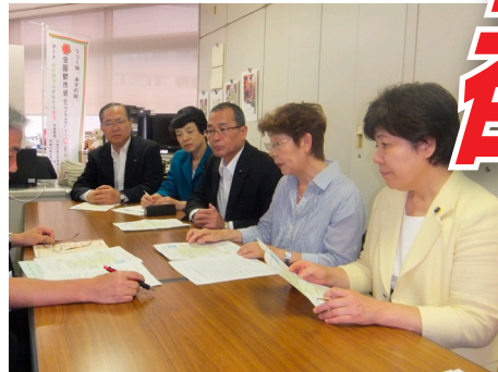
東京都への申し入れは3年半で80回以上

政治を動かす力のおもとは、国民のねがいと声。これがブレない共産党の信念です。都議会でも、日本共産党都議団が、都民のみなさんと力をあわせて、都政をうごかし、実現したことがたくさんあります。この力をもっと大きくさせてほしいのです。