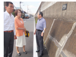
堤防の独自調査をおこなう共産党都議団

「東京湾岸やゼロメートル地帯の堤防や水門は、現状では大地震に対応できない」。現場調査をふまえての共産党都議団のくり返しの追及に、東京都も耐震強化10年計画を決め、耐震化がすすむことになりました。